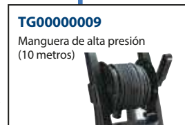
TG00000009 Manguera de alta presión (10 metros)