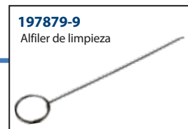
197879-9 Alfiler de limpieza