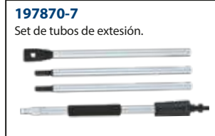
197870-7 Set de tubos de extensión.