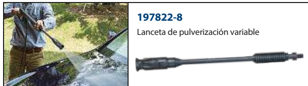
197822-8 Lanceta de pulverización variable