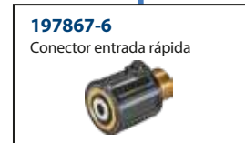
197867-6 Conector entrada rápida