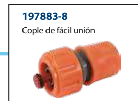
197883-8 Cople de fácil unión