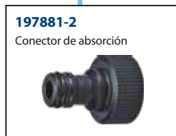
197881-2 Conector de absorción