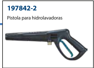
197842-2 Pistola para hidrolavadoras