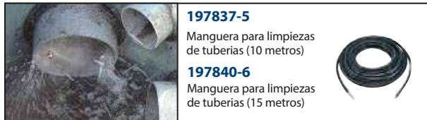
197837-5 Manguera para limpiezas de tuberías (10 metros)