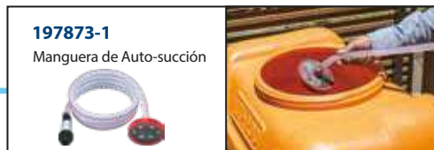
197873-1 Manguera de Auto-succión