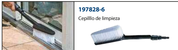
197828-6 Cepillo de limpieza