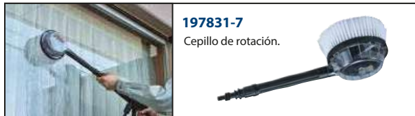
197831-7 Cepillo de rotación.