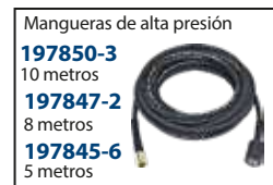
Mangueras de alta presión 197850-3 10 metros 197847-2 8 metros 197845-6 5 metros