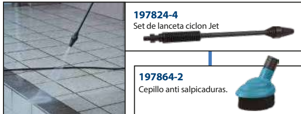
197824-4 Set de lanceta ciclón Jet