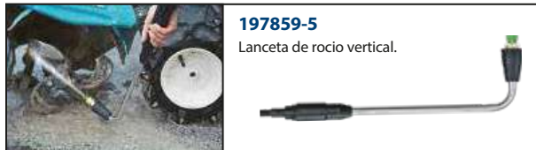
197859-5 Lanceta de rocío vertical.