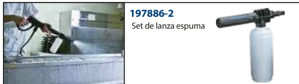
197886-2 Set de lanza espuma