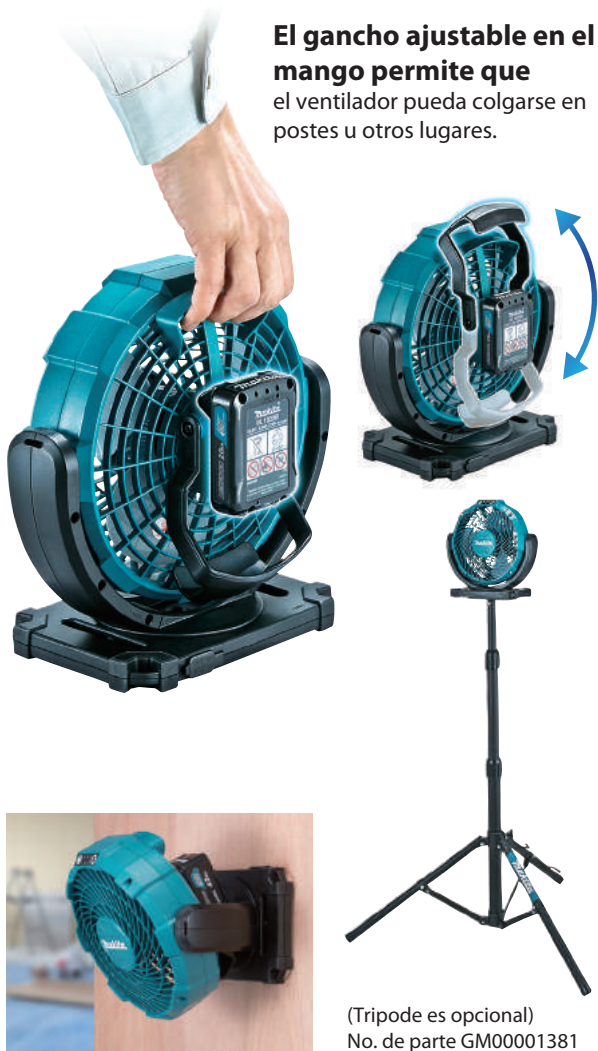
(Tripode es opcional) No. de parte GM00001381

El gancho ajustable en el mango permite que el ventilador pueda colgarse en postes u otros lugares.