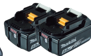
BL1850B 2 Baterías de 5.0Ah