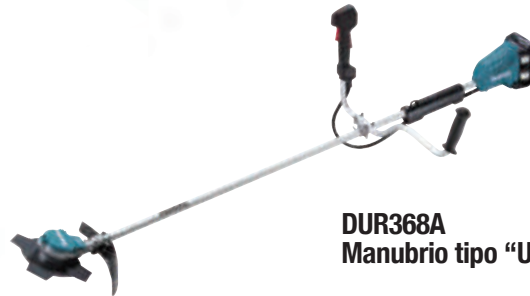
DUR368A Manubrio tipo "U"