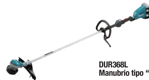
DUR368L Manubrio tipo "D"

El modo de funcionamiento puede seleccionarse para adaptarse al tipo de cuchilla.